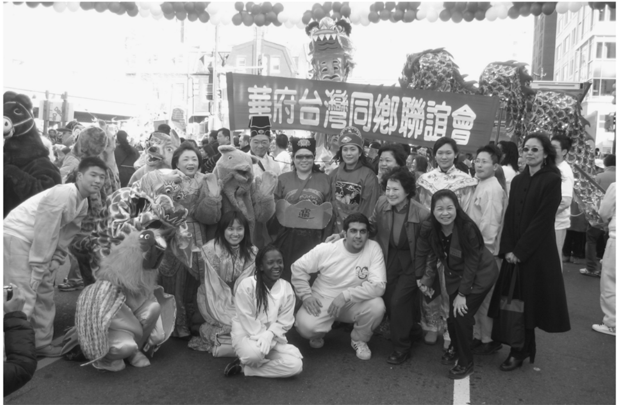
圖為春節中國城大遊行