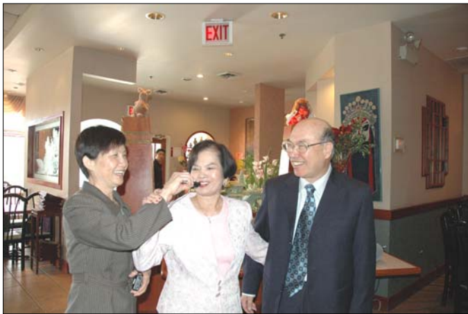
2008年5月10日 慶祝母親節餐會