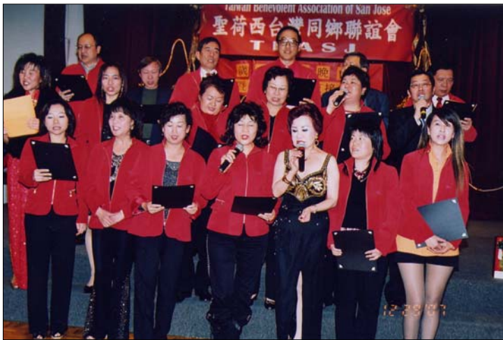
2007 歲末聯歡會聖荷西台聯會顧問及理事們大合唱