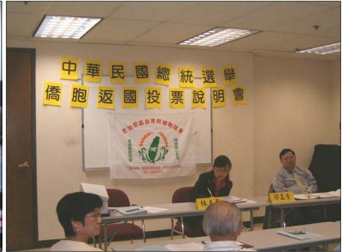
2007年10月20日 僑胞返國投票座談會