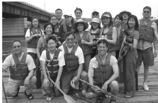
圖為台聯會參加龍舟比賽之隊伍在河邊練習划船後留影