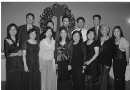
圖為致贈毛毯、禦寒衣物、日用品等至蒙郡洛城遊民收容所及中國城亞裔