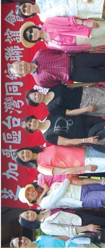
↑萬綠叢中一點紅，萬女叢中一俊男