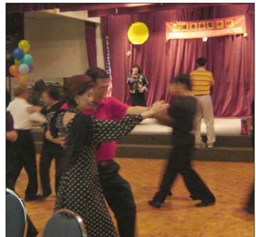
來賓在舊金山台聯會舉辦之中秋舞會翩翩跳探戈。