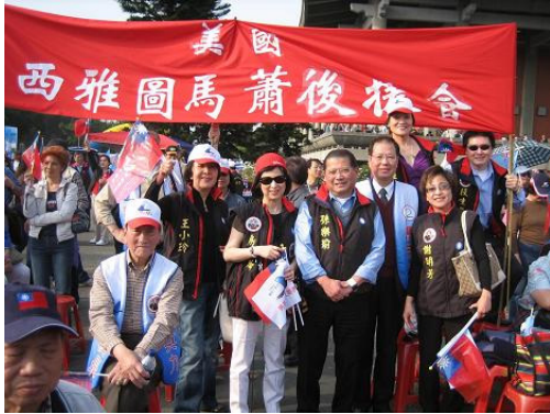
三月二十日國父紀念館內四海同心造勢