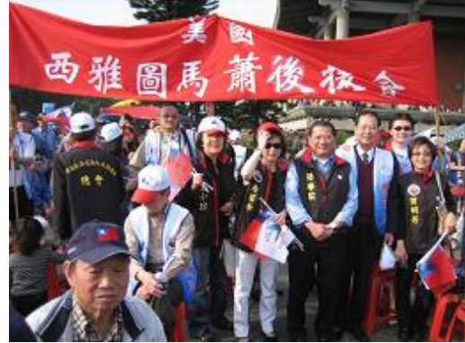
三月二十一日選舉前夕總統府前造勢