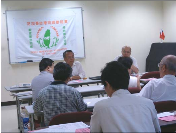
2007年8月4日 理事顧問會議