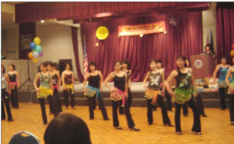
北加州排舞 (Line Dance) 協會在舊金山台聯會舉辦之中秋舞會隨勁歌節奏熱舞。

「跳躍青春賀中秋」舞會活動日期為2007年9月22日晚間六時至午夜，地點為南灣華僑文教中心。活動內容包含用餐、觀賞餘興節目、及熱舞至午夜，中場穿插多項精美禮品摸彩。