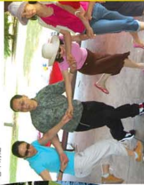
↑翩翩起舞，共度夏日好時光。

聯誼：Horseshoe Hammond 關注華人社區，友情贊助版面！ 2008年6月8日，北美華商酒廊，馬路賭博賭場（Horseshoe Hammond）斥資5個月的擴建工程，也將在6月8日舉行隆重開幕典禮，屆時將有精彩表演節目，歡迎各界人士踴躍參加。詳情請上馬路賭博賭場網站：www.horseshoe-chicago.com