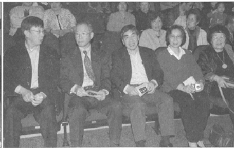
貴賓們在座欣賞演出